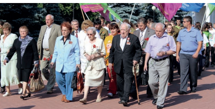
На мемориале «Памяти павших»

На исходе дня в Курской сельхозакадемии «за круглым столом» состоялась встреча гостей с ветеранами Великой Отечественной войны, преподавателями и студентами. Открывали и вели встречу председатель Курского городского Совета ветеранов