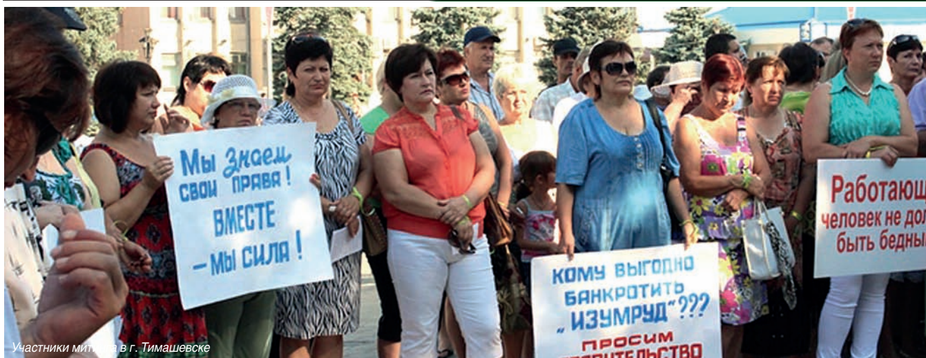
Участники митинга в г. Тимашевске