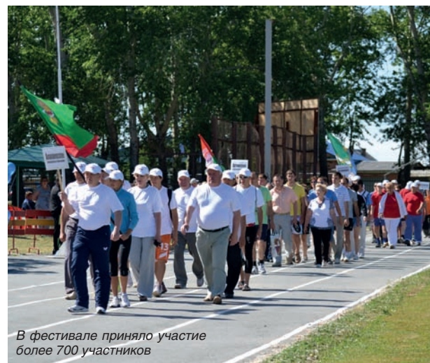
В фестивале приняло участие более 700 участников

По информации Свердловского областного комитета Профсоюза