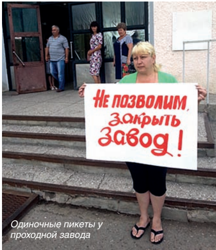
Одиночные пикеты у проходной завода