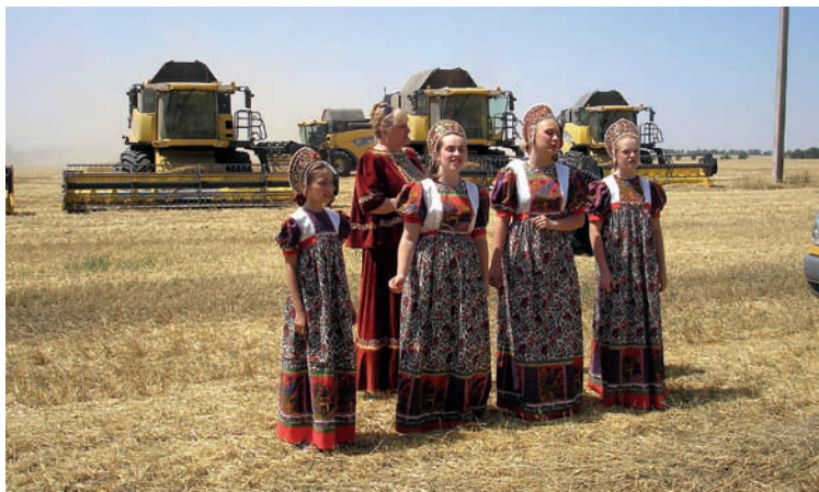
"Агитбригада" Автор - О.А.Манцурова, Ставропольский край

В июле на совещании по вопросу «О ходе проведения уборки урожая» Министр сельского хозяйства Российской Федерации Николай Васильевич Федоров озвучил первые цифры по уборочным работам, назвав их достаточно оптимистичными: «При урожайности зерновых культур 32,3 ц/га (в 2012 г. – 25,4 ц/га) с площади 5,8 млн. га (12,8 % к прогнозу) намолочено 18,8 млн. тонн зерна (на 8,2 млн. тонн больше 2012 года)».