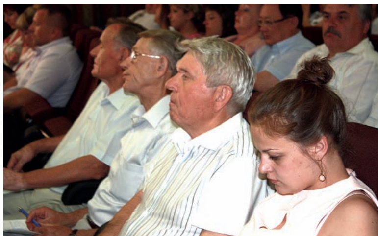
Участники заседания заседания Центрального комитета Профсоюза

Однако, несмотря на достигнутые положительные моменты в работе по реализации профсоюзной молодежной политики, хотелось бы остановиться на ряде проблемных вопросов. Главная проблема – это проблема кадровая. Нехватка