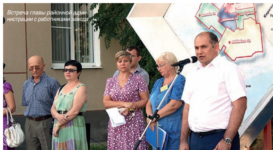
Встреча главы районной администрации с работниками завода

9 ИЮЛЯ. Более 200 человек приняли участие в митинге в центре города Тимашевска. Организатором акции протеста являлась первичная профсоюзная организация. В митинге приняли участие