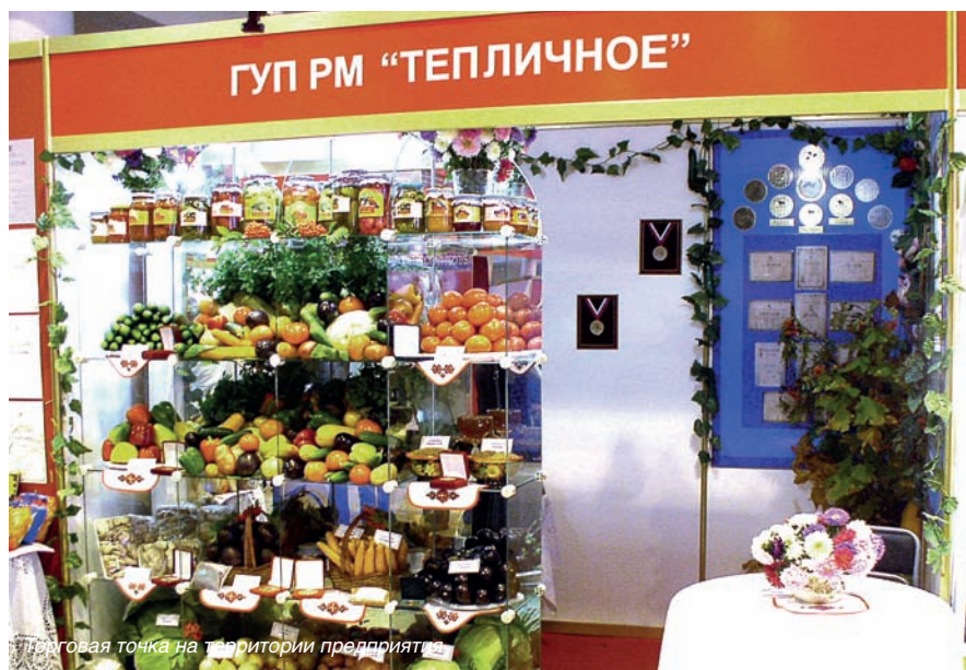
Торговая точка на территории предприятия

Президиум Профсоюза работников АПК РФ совместно с Президиумом Правления Росагропромобъединения подвели итоги Смотра-конкурса «Лучший коллективный договор организации АПК России» за 2012 год.