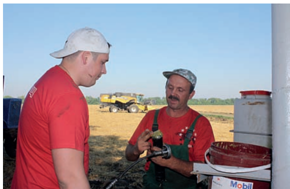
Автор - Е.А. Семенова, Краснодарский край

В первом квартале текущего года руководители министерства сельского хозяйства и министерства занятости, труда и миграции Саратовской области, государственной инспекции труда, областной организации Профсоюза работников АПК РФ направили совместное обращение главам администраций муниципальных районов, руководителям сельхозпредприятий и крестьянско-фермерских хозяйств, председателям профорганизаций работников АПК области с призывом усилить профилактику производственного травматизма.