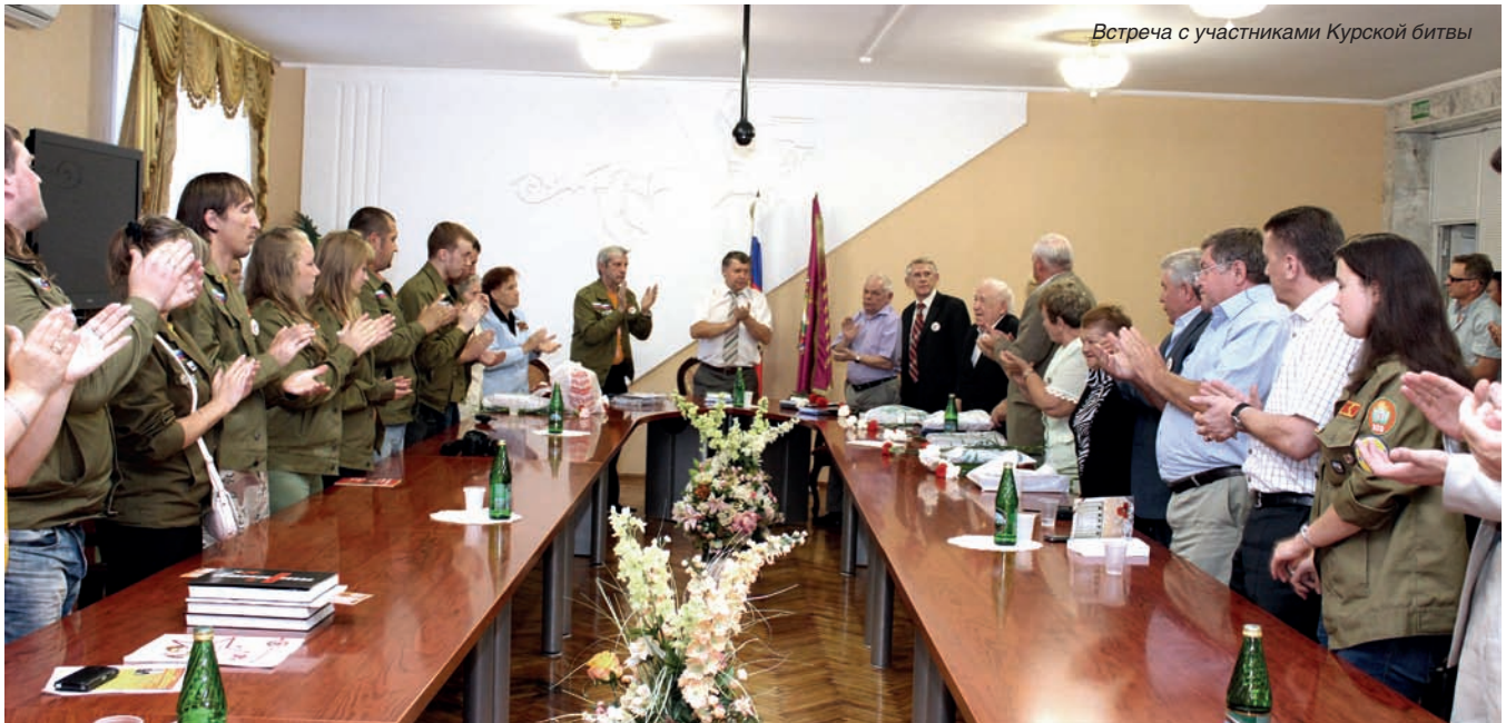
Встреча с участниками Курской битвы